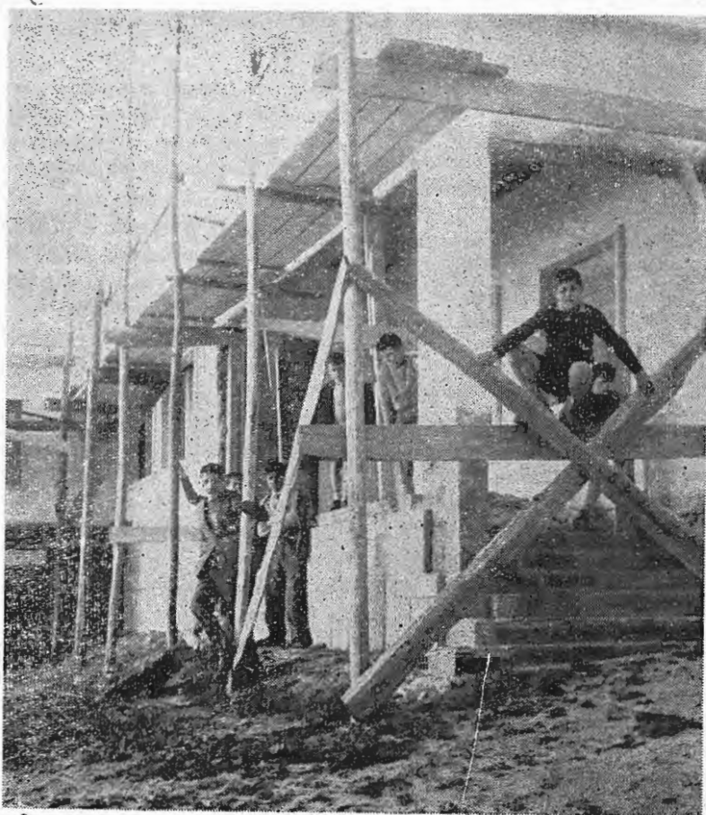
Radiantes no que é seu — a Colónia de Férias na Ericeira.